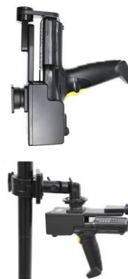
Robuste, passive Schnellentnahme-Halterung für MC3300 Gun mit Arretierungsfunktion für Wand oder Fahrzeugmontage. (Befestigungsarm optional)