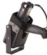
Passive Gerätehalterung (Face-down). Für Brick und Gun geeignet.