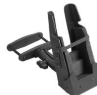
Robuste, passive Staplerhalterung mit Klemmhalterung.