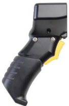
Pistolengriff für MC3300 Brick (Straight Shooter)