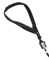
Schultergurt / Laynard, inkl. Strap. Laynard kann am Schultergurt oder an einem optionalen Hüftgürtel getragen werden.