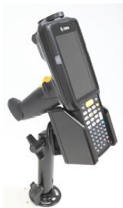
Robuste, passive Fahrzeughalterung mit Arretierungsfunktion am Kopf. (Befestigungsarm (klemmen, schrauben, Saugnapf) optional)