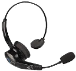
Headset kabelgebunden oder Bluetooth.